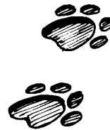
des emp reintes