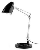
une lam pe