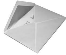
une en veloppe